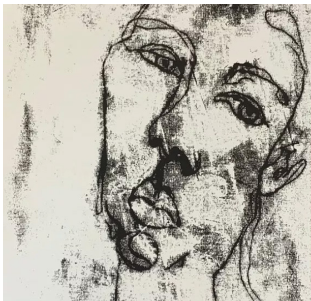
Met een inktplaat eronder