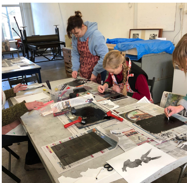
Op een ingerolde plaat inkt weghalen

Monotype is een toegankelijke en experimentele techniek, dat unieke prenten oplevert. Het is goed te combineren met het thema portretten. Het werk van Picasso kan hierbij inspiratie bieden.