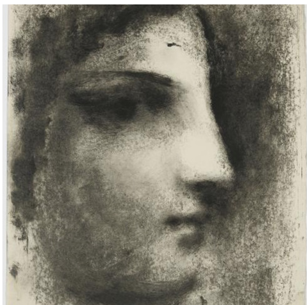
Inkt weggeveegd en afgedrukt van Picasso