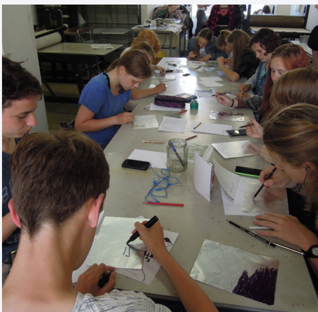
Op aluminiumfolie tekenen.

Tekenen op aluminiumfolie met inkt en zeep, zuren met cola. Een eenvoudige kennismaking met lithografie als vlakdruktechniek.