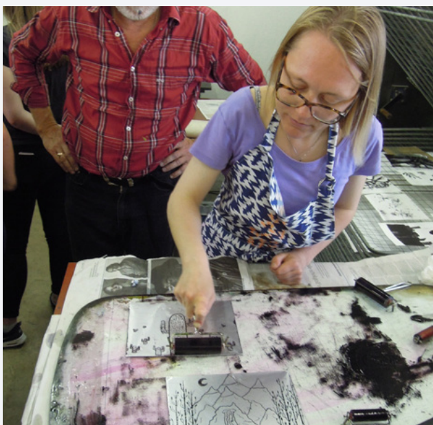
Inrollen met inkt