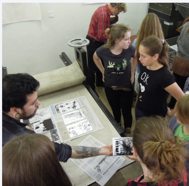
Afdrukken van de litho

Duur: 1,5 uur Aantal leerlingen: 15 per docent/ 15-30 tweede docent Geschied voor: iedereen vanaf minimaal 10 jaar Vorbereiding: niet nodig