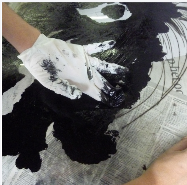
Plaatje in inkten en afslaan