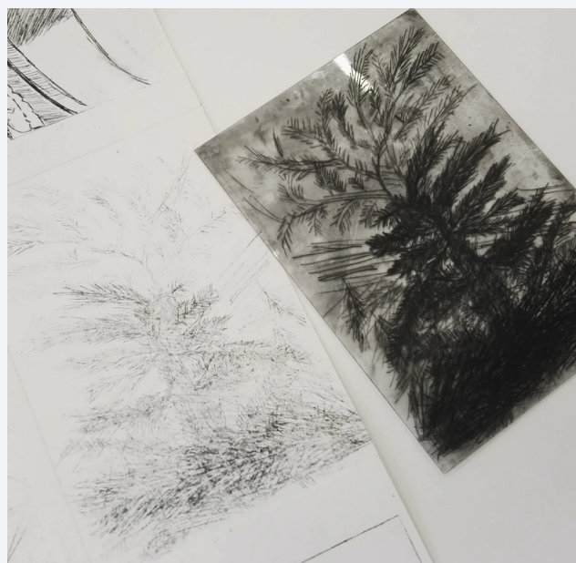
Etsplaat met afdruk