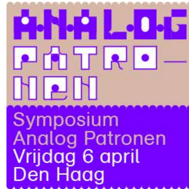
Ontwerp digitale banner Dennis Koot