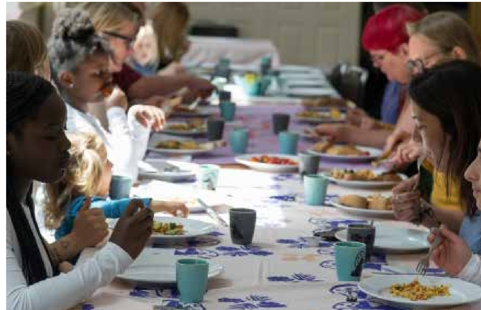
Boven: Lunch tijdens de Patronen Party met zelf gemaakte tafelkleden en mokken; Onder: Expositie Het Nieuwe Etsen