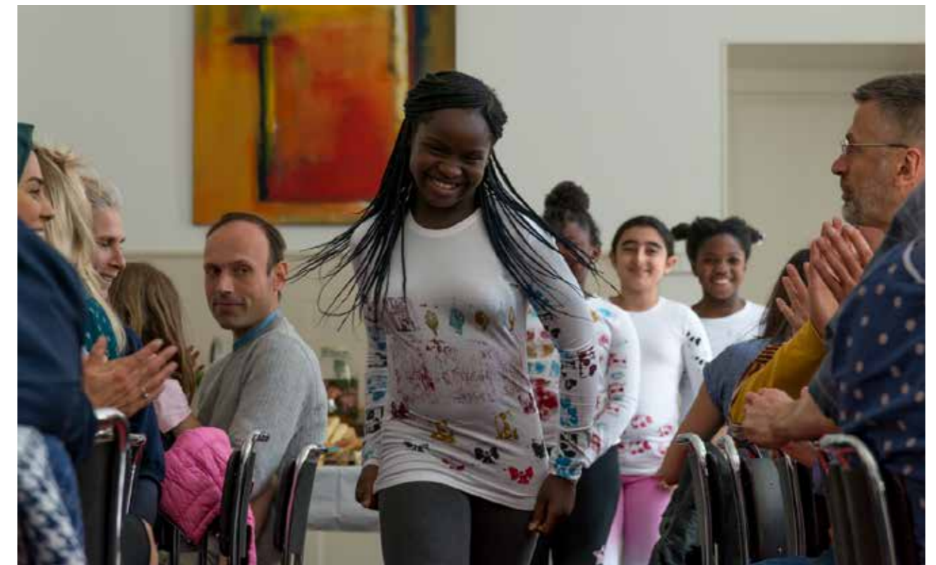
Meiden van Jeugdhaven in hun zelfbedrukte T-shirts tijdens Patronen Party

De werkplaats onderschrijft het belang van kunsteducatie. Onze workshops voor scholieren bereiken scholieren van verschillende leeftijden en achtergronden. De workshops bieden jongeren de mogelijkheid kennis te maken met druktechnieken en geven ruimte aan creativiteit. Zeker voor jongeren zijn creatieve uitingen belangrijk en helpen hen met het verruimen van hun denkwijze. Zo krijgen jongeren een open blik en meer begrip van de wereld om hun heen. De coördinator houdt contacten in het CKV-veld en was diverse keren aanwezig op bijeenkomsten van Cultuurschakel rond Cultuurondewijs op zijn Haags . Ook een van de docenten ging mee. Scholen kunnen direct via de Cultuurkaart betalen en ongeveer tweederde van de scholen doet dit.