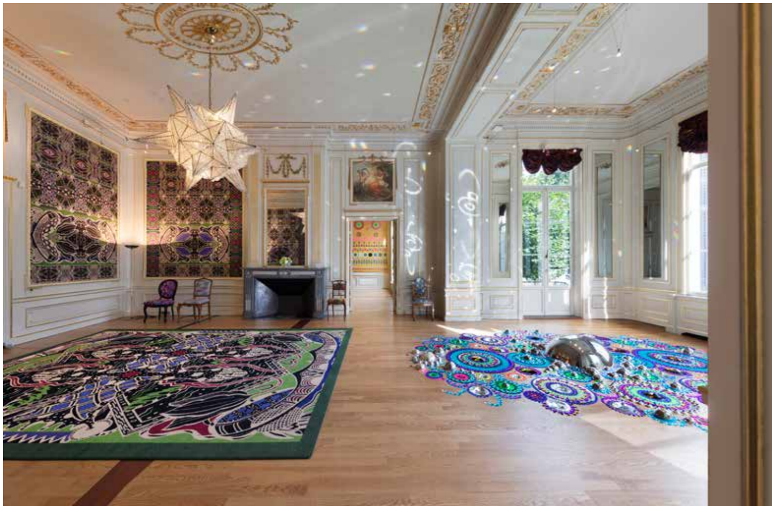
Once upon a Time, installatie van Christie van der Haak en Suzanne Drummen, foto's: Suzan Drummen