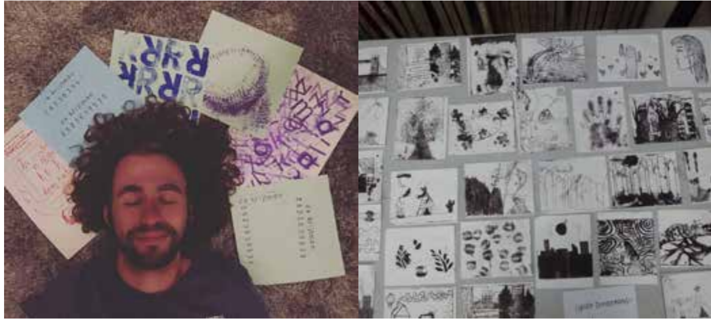
CKV-workshops en Monday Printing Club

Voor het festival werd ons CKV-aanbod uitgebreid met een workshop huis-tuin-en-keuken-litho inclusief een lesbrief. Drie klassen van twee scholen maakten hiervan gebruik met een totaal van 72 leerlingen. Ook na het festival blijven we deze workshop aanbieden.