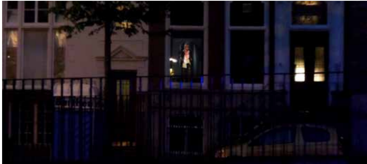
Beeld Charlotte van Winden

https://allevents.in/the%20hague/symposium-opening-analog-borders/796824723784142