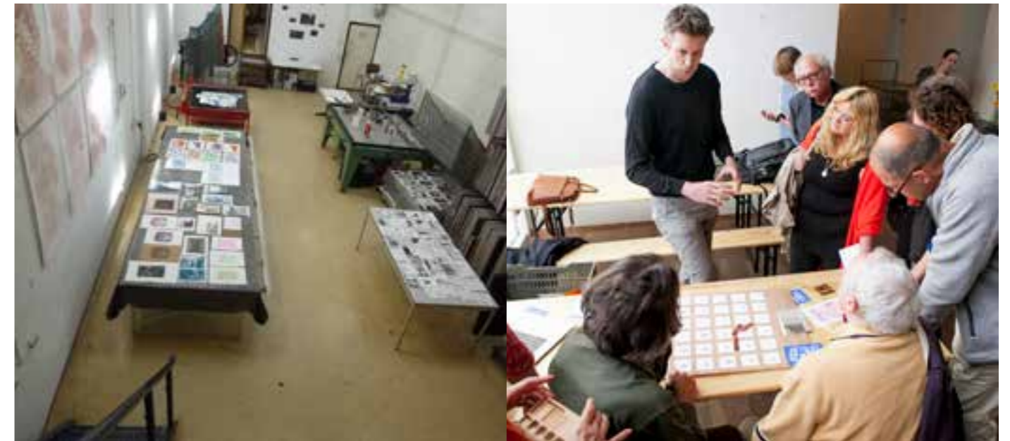
finissage tijdens Holaa

Een workshop waarin we analoge en digitaal totaal mixen en onderzoeken wat de lasercutter voor meerwaarde geeft aan de oude analoge technieken van linoleumdruk en etsen.