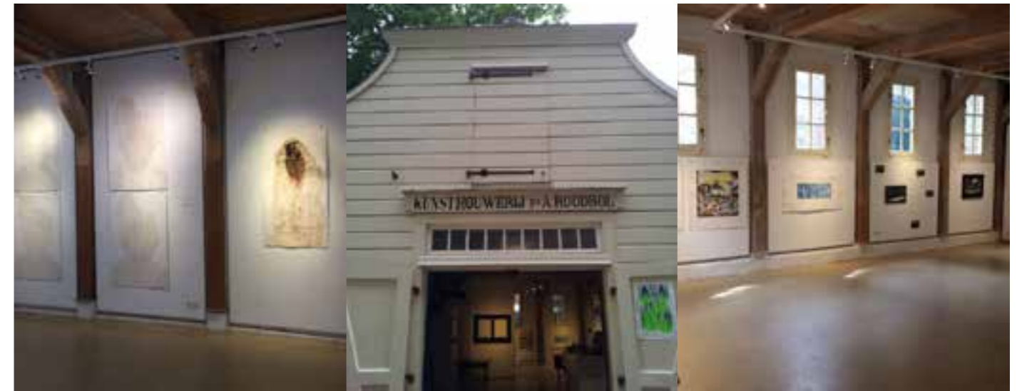
Overzicht expositie Analog Borders in Gouda

Fotografisch etsen met toyoboplaten. Een foto of een tekening op transparant overzetten op je etsplaat hoe doe je dat? En een fotobeeld riso'en of en+en: eerst een foto stencilen met de risograaf en dan etsen met toyoboplaten.