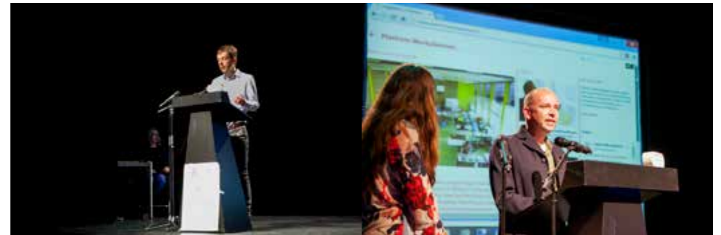
Symposium Analog Borders